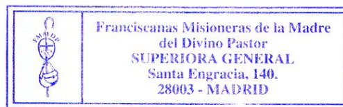
Mª Dolores Pereiro Superiora General.

(“Las personas consagradas y su misión en la escuela”. Nº 46)